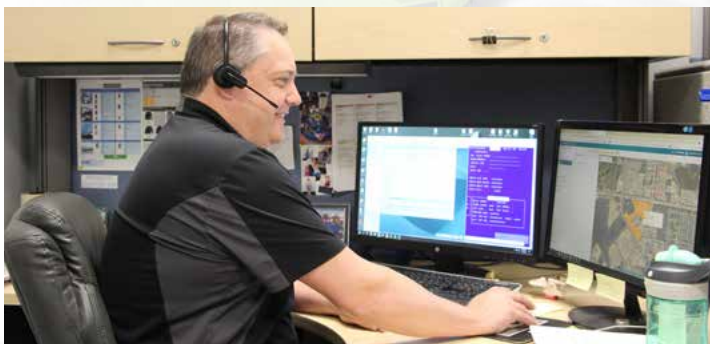
Équipe de la Centrale de Maintenance

Camions et Remorques Maxim dispose de ressources 24/7/365 dédiées à nos clients de location court et long terme partout au Canada. Le soutien à nos clients est ce qui nous sépare de nos concurrents. Avant de signer sur la ligne pointillée, considérez les capacités continues de gestion de flotte de votre fournisseur.